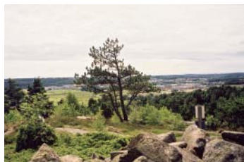
Västerberget är en del av Änggårdsbergen. Här finns bronsåldersrösen på bergskrönen.

För området finns föreskrifter och skötselplaner. Naturvårdsförvaltare: Park- och naturförvaltningen, Göteborgs stad. Inom området får inga åtgärder vidtas som kan medföra skada på riksintresset.