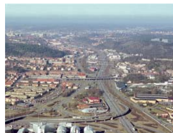
E6/E20 och Västkustbanan går rakt igenom Mölndals kommun i nord-sydlig riktning

Söderleden ligger inom detaljplan som vägområde med möjlighet till fler körfält. Utöver det generella ställningstagandet finns inget särskilt skydd. Vid utbyggnad av fler körfält krävs oftast nya planer och ställningstaganden.