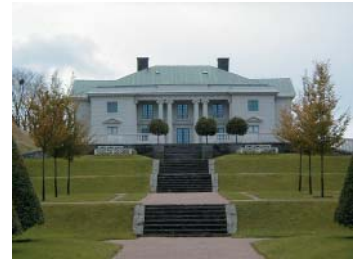
Gunnebo blev 2003 kulturreseptat

Mölndals Kvarnby har haft en avgörande betydelse, inte bara för den egna socknens, utan även för Göteborgsregionens utveckling. Som namnet antyder låg här tidigare en Kvarnby, omnämnd redan på 1300-talet, och det är denna verksamhet som