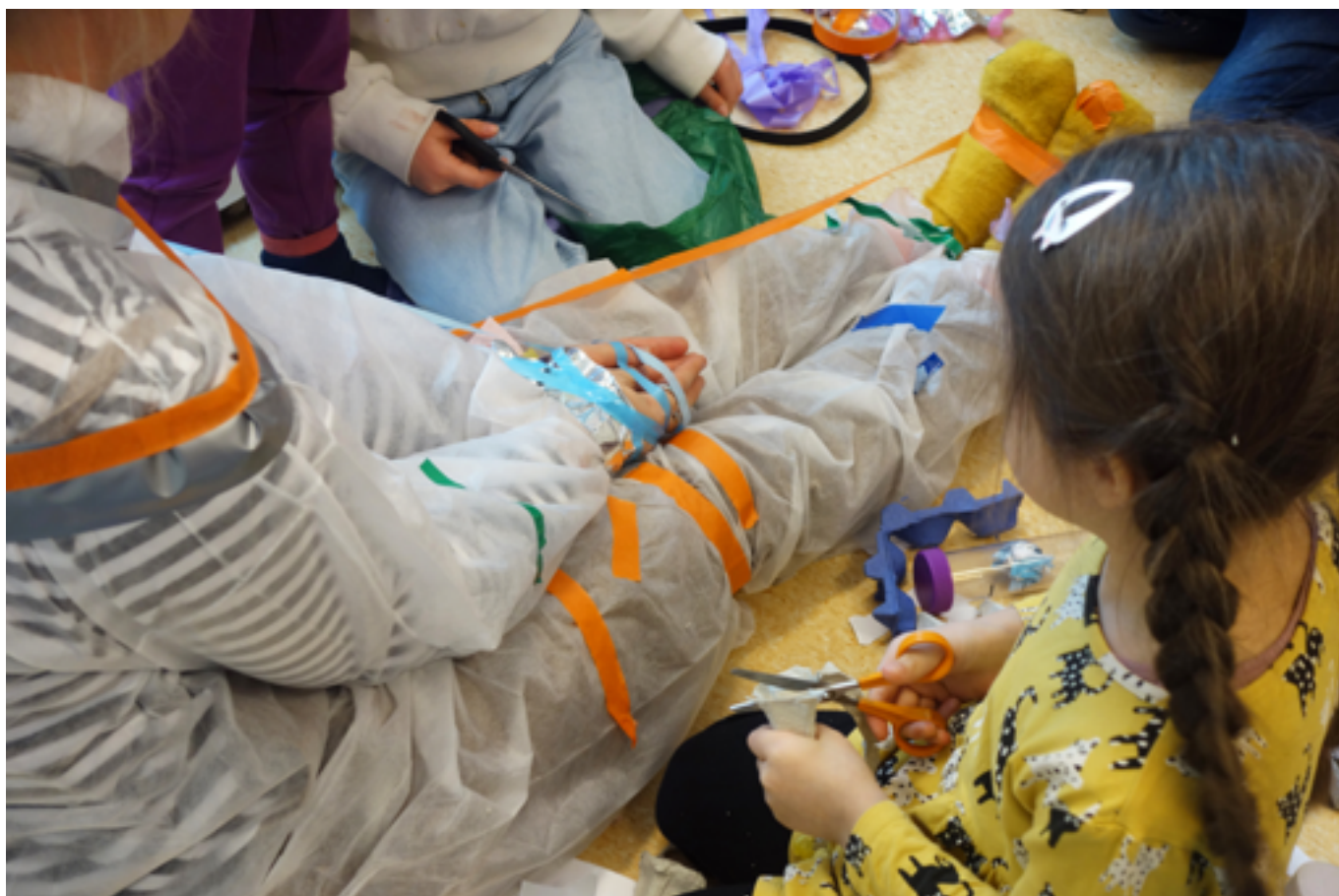
Foto "Fantasimateria" 2024 från offentlig gestaltning av konstnären Jelena Rundqvist till Bifrost förskola.