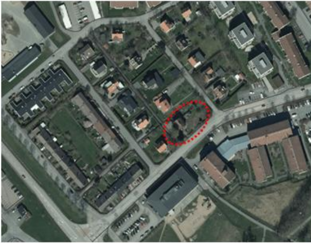
Ortofoto med fastigheten markerad (röd figur).