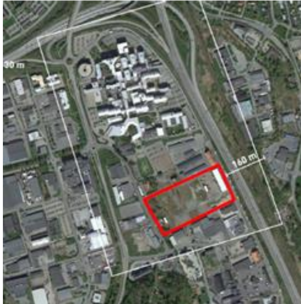
Översiktskarta respektive ortofoto över fastigheten