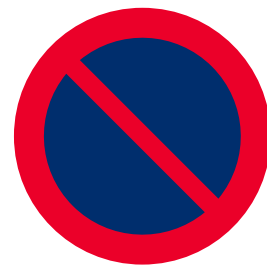
Förbjudet att parkera. Tillstånd för vårdsektorn gäller.