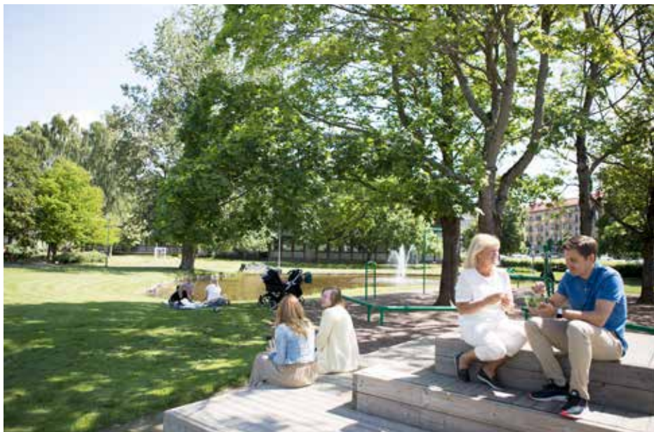
Stadsparken mitt i centrala Mölndal är en oas med café, utegym och stora gräsytor för både lek och vila.

Denna sommar kommer många att hålla sig hemmavid och göra kortare utflykter. I Mölndal finns mycket att se och uppleva. Besök Gunnebo slott eller Börsåsgrottan. Ta en fika där forsen brusar som högst eller i härliga stadsparken där det finns plats för både lek och vila. Gillar du att bada där det är långgrunt eller vill du hellre hoppa från brygga i djupare vatten? Möjligheterna är många.