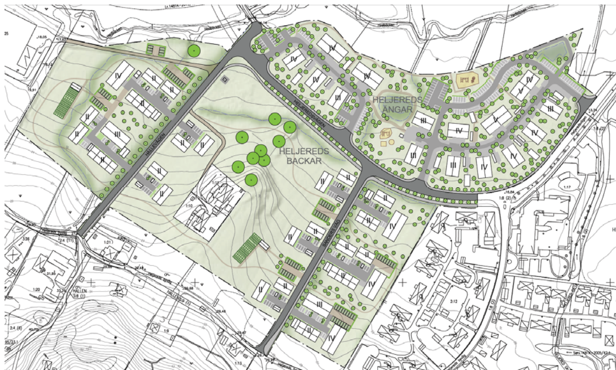
Utkast illustrationsplan till detaljplan

Förslaget anses vara ett steg mot en barnvänligare stad i och med dels skalan på bebyggelsen som planeras, vilket ger en mänskligare skala med goda ljusförhållanden både inne och ute, samt de rumsligheter som bebyggelsen och planen medger - där plats för spontanlek, rekreation och pedagogik finns. Planens möjlighet till framtida busshållplats skulle också stärka förbindelsemöjligheterna till Källered, Mölndal och Göteborg, vilket är en viktig aspekt i barn och ungas trygga rörelsemönster och utmaningar.