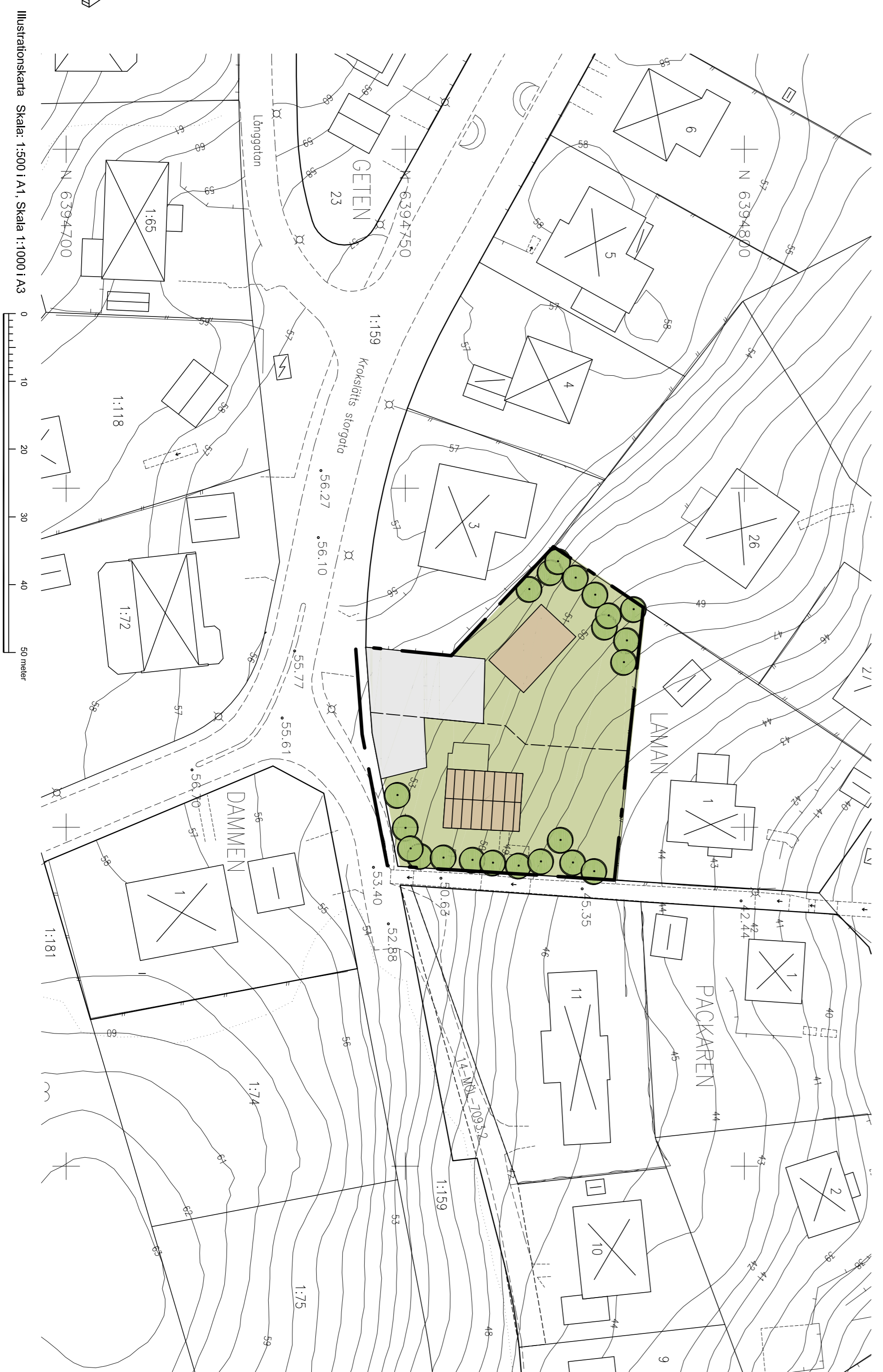
Illustrationskarta Skala: 1:500 I A1, Skala 1:1000 I A3