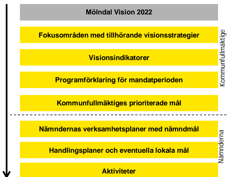
Figur 2 Mölnadal Stads styrmodell

Mölnadal Stads målkedja beskrivs i dokumentet Begrepp i målstyrningen . Målkedjan illustreras i nedanstående figur.